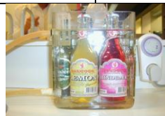
Holdbarhedstest i isvand

Vores etiketlim i sommer version er designet til at blive brugt på eksport markeder hvor der er høje temperature i produktionslokalerne.